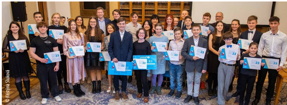
Slavnostního finále ve Vlasteneckém sále Univerzity Karlovy se zúčastnilo 24 finalistů.