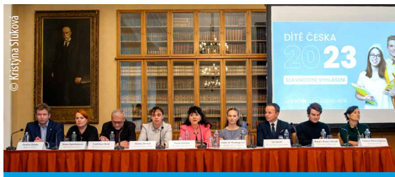
O vítězi ankety Dítě Česka rozhodla 14členná porota.